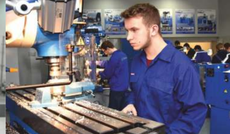
PRACOWNIA OBRABIAREK KONWENCJONALNYCH