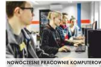
NOWOCZESNE PRACOWNIE KOMPUTEROWE