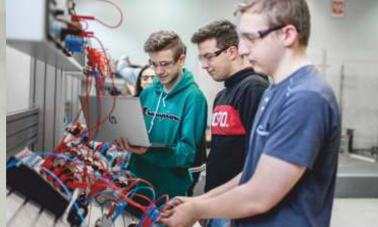
PRACOWNIA MECHATRONIKI PRZEMYSŁOWEJ