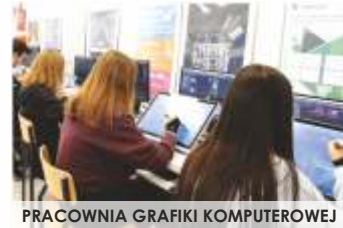
PRACOWNIA GRAFIKI KOMPUTEROWEJ