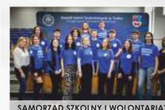
SAMORZĄD SZKOLNY I WOLONTARIAT

ZESPÓŁ SZKÓŁ TECHNICZNYCH im. gen. prof. Sylwestra Kaliskiego w Turku