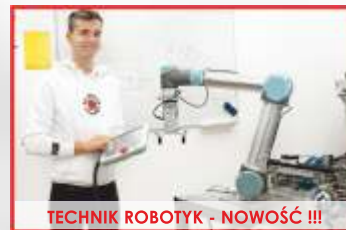
TECHNIK ROBOTYK - NOWOŚĆ !!!