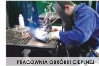
PRACOWNIA OBRÓBKI CIEPLNEJ