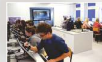
W PEŁNI SKOMPUTERYZOWANA BAZA DYDAKTYCZNA