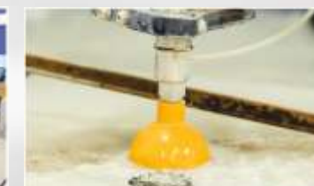
MASZYNA DO CIĘCIA STRUMIENIEM WODY - WATERJET