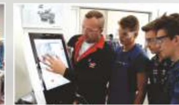
PRACOWNIA OBRABIAREK CNC FIRMY DMG MORI

Więcej informacji możesz uzyskać na www.zst.net.pl