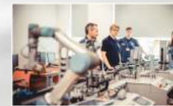
ZAUTOMATYZOWANA LINIA PRODUKCYJNA FIRMY SIEMENS