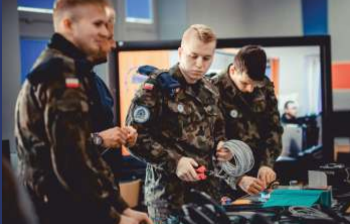
PRACOWNIE INFORMATYCZNE I TELEINFORMATYCZNE