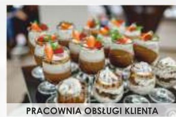
PRACOWNIA OBSŁUGI KLIENTA