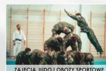
ZAJĘCIA JUDO I OBOZY SPORTOWE