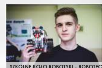
SZKOLNE KOŁO ROBOTYKI - ROBOTECH