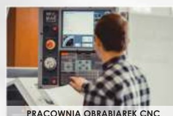
PRACOWNIA OBRABIAREK CNC