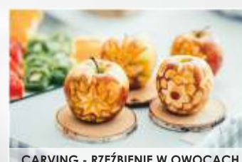
CARVING - RZEźBIENIE W OWOCACH