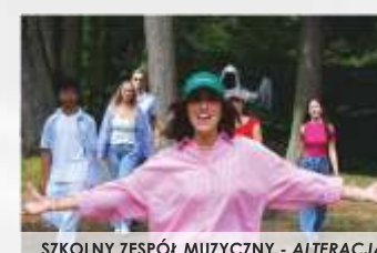
SZKOLNY ZESPÓŁ MUZYCZNY - ALTERACJA