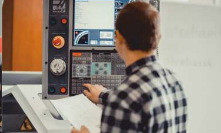
PRACOWNIA OBRABIAREK STEROWANYCH NUMERYCZNIE CNC